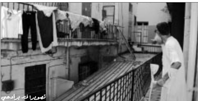
لا يزال خطر الانهيار الجزيئي يطارد سكان المبنى رقم (2) بشارع همو بوتيليس بوسط المدينة، هذا المبنى يضم منذ سنوات طويلة ستة (6) عائلات تعيش اليوم في ظروف قاسية جداً بليل أنها اضطرت إلى استعمال سلم خشبي للوصول إلى طابق كمين السلام التي انهارت كلياً منذ فترة، وهذا الوضع أدى إلى وقوع حوادث خطيرة بحيث سقطت جدران تبلغ من العمر 65 سنة منذ فتحتم لإصابات خطيرة تلت على إثرها إلى مملكة الاستعمالات، ونفس الحادث تعرض له شيخ يبلغ من العمر 72 سنة منذ عدة أيام عندما حاول الوصول إلى شقته باستخدام ذلك السلم الخشبي.