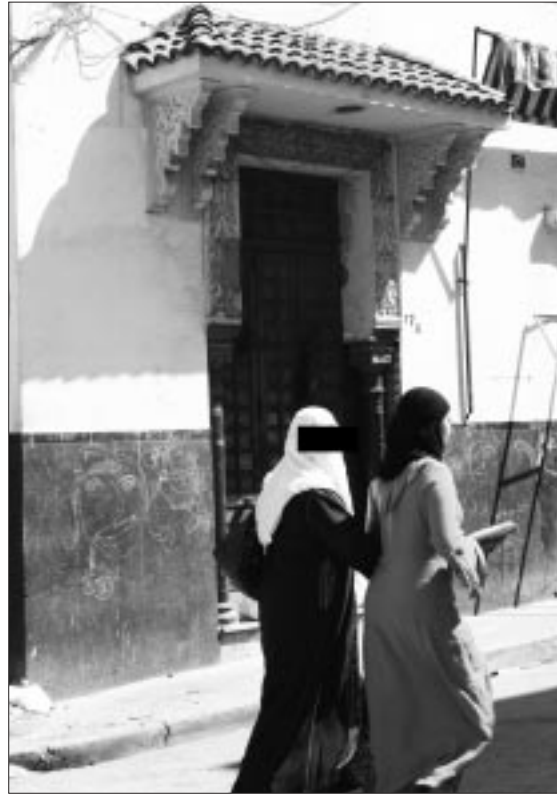
الحمامات الشعبية لم تلتقد يوما مكائنها

وتشمل الدائرة الإنتخابية لبلدية وهران كل من فرع السانيا، وبلديات مرسى الكبير، وعين الترك وبوسفر، وسيدي الشامي وقالمي ومانجان (البرية حاليا) وسانت برب بوتليات أي تيليات وتامزوغة والقطاعات البلدية التابعة لهذه البلديات، ويبدأ تسليم بطاقات الإنتخاب ببلديتي وهران والسانيا يوم الإثنين 25 جويلية 1870 من الساعة السابعة الى العاشرة صباحا ومن الساعة الواحدة بعد الظهر الى الساعة الخامسة مساء ويتواصل هذا التوزيع حتى يومي الإنتخاب.