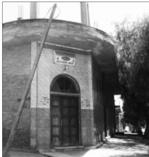
حمام حاسي عامر الذي شهد حادثة الانفجار الأخيرة

وهي تلك الإشارات التوجيهية داخل الحمام كما أن شبكة الإنارة الكهربائية داخل الحمام تخضع لمقاييس وشروط خاصة بهذه المؤسسة إذ يجب أن تكون مؤمنة بطريقة جيدة لتفادي احتكاكها بالماء وهو ما لانجده ببعض الحمامات التي نقصدها فتكون الخيوط ظاهرة وأحيانا ممزقة ومخرّبة ما يعرض المترددين عليها لخطر الإصابة بصعقة كهربائية كما أن شبكة التموين الكهربائي بالحمامات يجب أن تكون من النوع السميكة المضاد للرطوبة والمؤمنة من الانقطاعات فيجب أن تعمل بنظام التخزين حتى لاتنقطع الإنارة مع انقطاع الكهرباء.