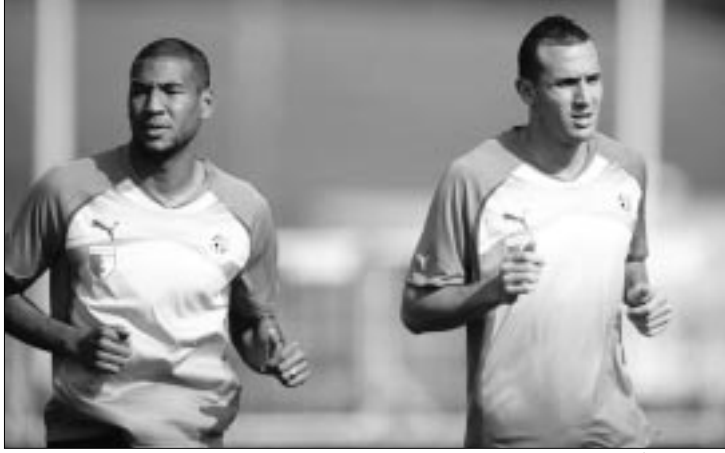
بلسيد هو الآخر انضم للتدريبات رفقة بيده.

أجرى المنتخب الوطني الجزائري منتصف نهار أمس حصته التدريبية الثانية بمركب أوغو في حدود الساعة الحادية عشر و 45 دقيقة بمرکز إقامته وذلك تحضيراً للمباراة الأولى في موندنال جنوب إفريقيا الذي سينطلق بعد يومين وسيواجه الخضر منتخب سلوفينيا يوم 13 جوان الجاري، وهو ما جعل أشبال سعدان يدخلون مرحلة الجدّ خلال هذه الفترة مع اقتراب المواعيد الرسمية الهامة ودخول غمار المنافسة حيث يشتد الضغط على اللاعبين الذين يحاولون التحضير في أسنن الظروف وهو الذي يبقى متوقفاً في محل إقامة المنتخب الوطني بمدينة دوربان ما