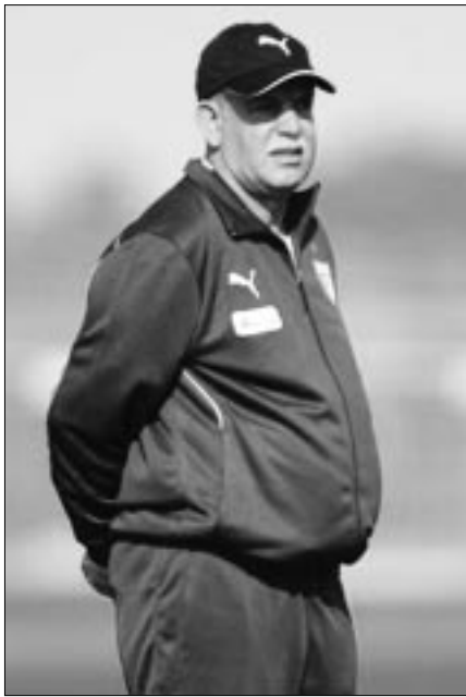
ضغط كبير على الناخب الوطني

اعتبرت الاتحادية الدولية لكرة القدم (الفيفا) أمس الثلاثاء أن الجزائر التي تعد إحدى المنتخبات الإفريقية القادرة على البروز خلال هذا المونديال عازمة على خوض غمار منافسات كأس العالم بجنوب أفريقيا. وكتبت الفيفا على موقعها الإلكتروني في مقال خاص حول حفظ المنتخبات الإفريقية في مونديال جنوب أفريقيا الذي ستطلق فعالياته يوم الجمعة أن «الجزائريين عازمون على غرار البلدان الإفريقية الأخرى على البروز في هذه المنافسات». وأضافت الفيفا إن الخضر «أثبتوا ذلك خلال التصفيات و كذا خلال كأس أفريقيا للأمم الأخيرة حيث حصلوا على المرتبة الرابعة». وتشارك القارة السمراء للمرة الأولى بست منتخبات في كأس العالم وهي جنوب أفريقيا (البلد المنظم) والجزائر ونيجيريا والكاميرون وغانا وكوت ديفوار. وبخصوص حفظ المنتخبات الإفريقية الأخرى اعتبرت الفيفا أن «القارة السمراء تعولت على أحداث المفاجآت وتحدي التكهنات». واعتبرت هيئة كرة القدم العالمية أن «الأفارقة يأملون في أن يكون تنظيم كأس العالم لأول مرة بقرنتهم فرصة للبروز أكثر». من جهة اعتبر اللاعب الغاني السابق عبيدي بيبي أن «المنافسة ستكون صعبة بالنسبة للمنتخبات الإفريقية» كونها ستلعب أمام منتخبات كبيرة. وأضاف عبيدي بيبي أن «المنافسة تعد أحسن فرصة للفرق الإفريقية للفوز بكأس العالم ومهما كانت النتائج فإن ذلك سيكون مفخرة كبيرة لنا». من جهة أكد اللاعب الزامبي السابق كوالشا بواليا «لدينا الثقة والخبرة» وأضاف «أنا مقتنع اليوم بأن فرقنا تؤمن بقدراتها ومستوياتها». وأرجع