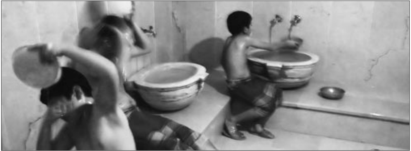
عدم مطابقة نظام التسخين بقاعة الإستحمام يشكل خطرا كبيرا