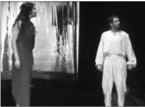
مشهد من «مغري النجوم» الفائزة بالجائزة