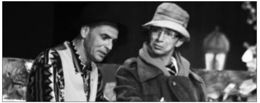
مشهد من المسرحية