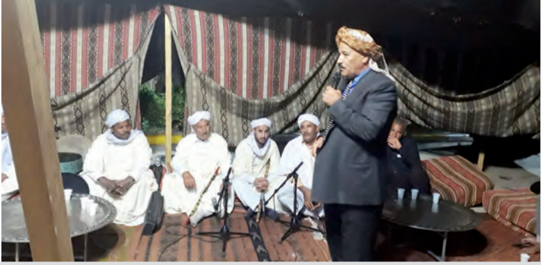
بقلم: صالح رويبي

كان التحدي المتواصل بلا فواصل، والميدان يغني عن كل توضيح وبرهان. «الشعر الملحون.. الشعبي» في أرض الجزائر، يحتاج إلى جمع وتحقيق وطبع ونشر وتوزيع، من قبل «أهل الاختصاص» الذين يجمعون بين [الدراسة والممارسة.. والتقديم والتقويم] هذا من جهة، وبروز «الجمعيات المهمة.. بالشعر الملحون».. بصفة معتمدة من جهة أخرى. إن «الملتقيات الجهوية والوطنية والمحلية» (ثلاثية) متكاملة فاعلة.. في مسارات استنطاق الذاكرة التراثية الكامنة في قصائد «الشعر الملحون» الجامع بين «جيل التحرير».. وجيل الاستقلال (ثنائية) «الأصالة الفاعلة» والتجديد النوعي المتواصل.