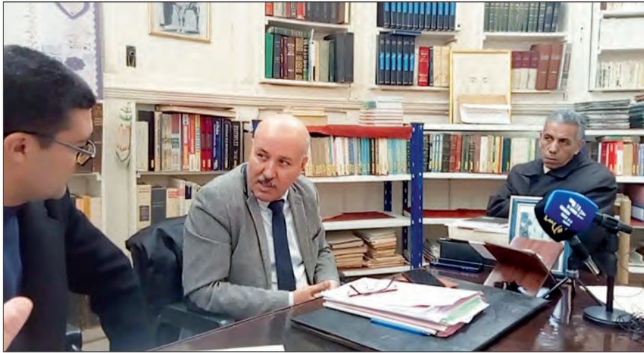
حظيرة النقل البري بالولاية يتراوح سنها من 17 إلى 20 سنة

تعد خطوط النقل البري الأكثر استعمالاً ورواجاً من قبل المواطنين للتنقل سواء بين البلديات والولايات وحتى الأرياف، حيث تتكون حظيرة النقل البري بالولاية من 1331 متعاملاً، وتضمن التنقل لـ 42 ألف و25 شخصاً، معدل سن الحظيرة يقدر بـ 17 سنة، كما أن 95 بالمائة من الحظيرة تابعة للقطاع الخاص، بحسب تصريحات مدير النقل الذي تطرق بالتفصيل إلى أنواع النقل البري من حافلات النقل بين البلديات، النقل الريفي وخطوط بين الولايات والنقل المدرسي والنقل الجامعي ونقل العمال وخلال كلمته أشار المدير إلى أن سن الحظيرة الخاصة بالنقل البري بالولاية يتراوح من 17 إلى 20 سنة، وبخصوص هياكل النقل على مستوى الولاية أشار المسؤول إلى أن هناك العديد من البلديات بالولاية هي بحاجة ماسة إلى محطات برية جديدة على غرار تيفينغ والبرج وعين فارس وغريس ووادي التاغية وعوف ووادي الأبطال والحشم ووادي التاغية وتيزي.