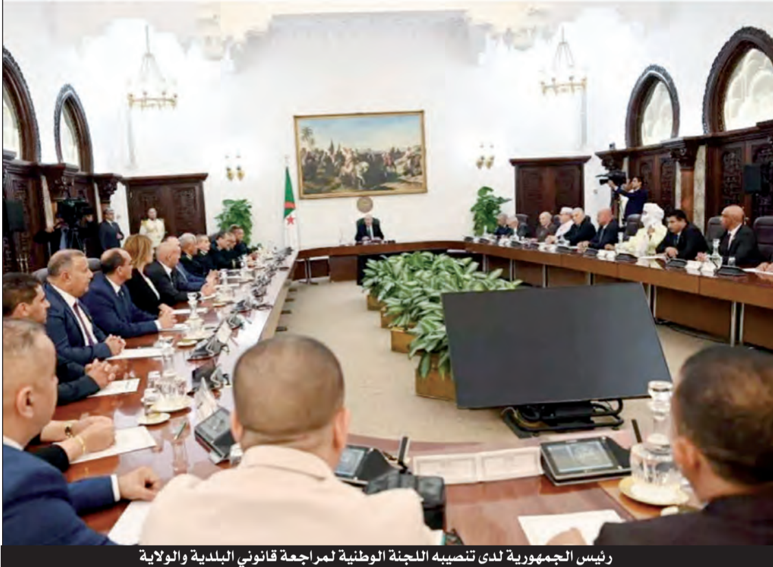
رئيس الجمهورية لدى تصيحه للجنة الوطنية لمراجعة قانوني البلدية والولاية

ويأتي احتفال هذا العام في ظل اهتمام بالغ من السلطات ورئيس الجمهورية عبد المجيد تبون، الذي التزم بتجسيد إصلاحات قانونية جديدة على مستوى قانوني الولاية والبلدية، بهدف تعزيز الحوكمة المحلية وتحسين جودة الخدمات، فالبلدية تعد الخلية الأساسية في بناء الدولة، وتؤدي دورا محوريا في تسيير الشؤون المحلية وتلبية احتياجات المواطنين.. والأكد أن البلديات شهدت تطورا ملحوظا، لكنها واجهت أيضا تحديات تتعلق بالتمويل، الحوكمة، وضعف الصلاحيات الممنوحة للمنتخبين المحليين. والمعروف أنه وفي العقود الأخيرة شهدت محاولات عديدة لتعزيز دور البلديات من خلال مشاريع تنموية مختلفة، إلا أن غياب رؤية شاملة وهيكل قانوني حديث كانا دائما عائقين أمام تحقيق هذه الأهداف، ففي الوقت الذي تعمل فيه العديد من البلديات على تحسين البنية التحتية وتقديم الخدمات الاجتماعية، تعاني أخرى من أزمات مالية وضعف التخطيط، خاصة في المناطق النائية والجنوبية. رغم هذه التحديات، تمثل البلديات مساحة خلق الحلول المحلية، فعلى سبيل المثال، تمكنت بعض البلديات من تحقيق قفزات نوعية في مشاريع النظافة والتحول الرقمي، فيما لا تزال أخرى تعاني من نقص الكفاءات البشرية والموارد المالية. ويجمع الملاحظون على أن إصلاحات رئيس الجمهورية عبد المجيد تبون التي تخص البلديات من خلال مراجعة قانوني الولاية