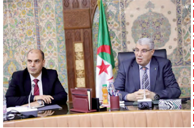
هياة.ب / تصوير فوزي برادعي

شدد والي وهران سمير شيباني أمس على ضرورة التجند جميعا أولياء ومنظمة تربوية وجمعيات أولياء التلاميذ من أجل التصدي بكل حزم ضد الأخطار التي تستهدف أبنائنا وبناتنا وحماية المدرسة الجزائرية من محاولات التشويش والوقوف في وجه المحاولات اليائسة للتلاعب بمستقبل التلاميذ من خلال دفعهم إلى الشوارع وتشجيعهم على مغادرة مقاعد الدراسة.