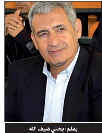
بقلم: بختي ضيف الله

سلام على كل من أحب أرضه ولم يضع مفاتيح المدينة