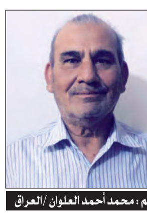
بقلم: محمد أحمد العلوان / العراق

أقبلت وحدك ما التفت إلى الورا وعصاك قد ضربت بصبرك أبحرا أقبلت لم تخشى الذين تجبروا أقبلت والجمع المدجج أدبرا أفحمت مارلت خطاك... طريقكم بالصدق عبد بالشهادة أزهر مهما طغوا لن يستطيعوا ردكم النصر... وعد الله.. لن يتأخرا