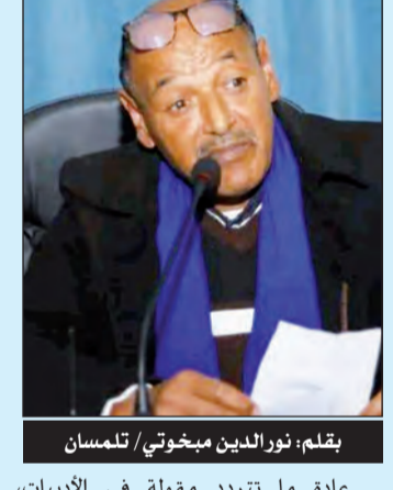
بقلم: نور الدين ميخوتي / تلمسان

هذه الروح توأم الصخرة توأم سيات مقضى برائحة البارود توأم وسادة يفر عنها غزال الكرى أهددها بكل أسماء الطيور وأقراص العنبر البدوي وأجلسها معي على كراسي الهديل لعل بروقا أو جناح بجع أبيض يطل لكنها السماوات رغم حنين الزرقعة وأطباق البياض وانتثار اللزورد على شفة الغيمة وانفتاح اللفز على مدارات القلب ورغم هبوب الكؤوس ما بين سطر وسطر ما بين نحلة ومرعى غزلان ما بين الدار التي تركت نصف محبتها