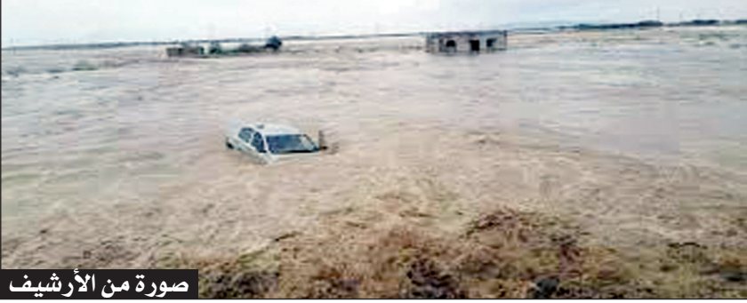
صورة من الأرشيف

ومن جهتها قامت مصالح الدرك الوطني بغلق عدة طرقات وطنية وولائية عبر التراب الولائي، منها خاصة تلك المملوءة بمياه الأمطار والتي تشكل خطرا على الساكنة والتي بلغ منسوبها أكثر من 50 ملم، كما بأشرت مصالح ديوان التطهير لعين تموشنت عدة عمليات لفك الانسدادات الواقعة بالأحياء والشوارع الكبرى للمدن، منها مفر الولاية وحمام بوحجر وعين الأرباع وعين الكيحل بتسخير كافة الإمكانيات البشرية والمادية لضمان سيرورة العمل