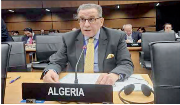
الدولة للطاقة الذرية، في إطار ولايتها، إلى دولة فلسطين من المعدات التشخيصية وتبني برنامج استعجالي يغطي احتياجات والعلاجية اللازمة.

أكد المندوب الدائم للجزائر بفيينا، السفير العربي لطروش، خلال مشاركته في أشغال دورة العادية لمجلس محافظي الوكالة الدولية للطاقة الذرية، على الحق "الأصيل وغير القابل للتصرف" في الاستفادة من الاستخدامات السلمية للطاقة النووية عن طريق نقلها الميسر وغير المشروط للدول النامية، خاصة الإفريقية، بغية المساعدة على تحقيق أهداف التنمية المستدامة.