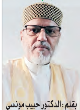
يقلم: الدكتور حبيب مونسى