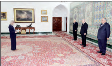
مجلس الأمن الأممي الذي تعد الجزائر عضوا غير دائم فيه.