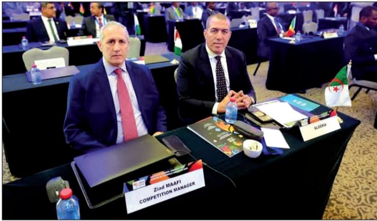
الأولمبية الإفريقية، بعد أسبوع فقط بعد أشغال الجمعية العامة التي استضافتها الجزائر على مدار 3 أيام، وعلى هامش هذه الأشغال كرمت هيئة اللجان الوطنية الأولمبية لإفريقيا رئيس الجمهورية السيد عبد المجيد تبون بالوسام الذهبي

يواصل الجيدو الجزائري تقوية تمثيله في الهيئات القارية والعالمية، وهذه المرة جاء الدور على ياسين سيليني الذي تم تنصيبه من قبل رئيس الكونغرس الإفريقي للجيدو "سيستي تيري رانداناسولونياكو" مسؤولاً عن المنافسات الإفريقية بالكونغرس الإفريقي، بحيث جاءت مراسم التنصيب بمركز تجمع وتحضير النخبة الرياضية الإخوة سوكان بفوكة في ولاية تيارزة، ويأتي هذا التنصيب نظير الخدمات الاستثنائية التي قدمها ياسين سيليني للجيدو الإفريقي، وتفانيه في خدمته والتزامه الثابت بشكل كبير في تطويره بإفريقيا.