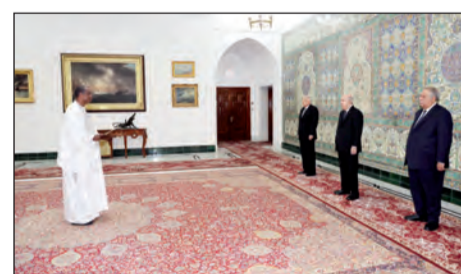
بالعمل مع مختلف السلطات السنغال يولي أهمية بالغة والتعاون الثنائي بين البلدين. للشراكة مع الجزائر ونحن ملتزمون