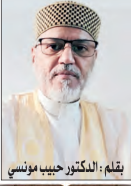
يقلم: الدكتور حبيب مونسى

في هذه اللحظة الفارقة من الأحداث الدامية، وهذه الثورة من الإفساد والتهور، يعلن الله عز وجل عن حقيقة (الحشر) النبوي فيقول: (هو الذي أخرج الذين