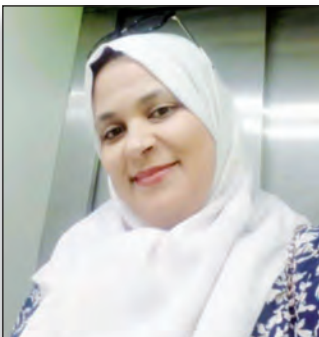
يقلم: بن سيد سعاد مستشارة بمنظمة العمل السياحي وأمنية التراث والبيئة السياحية بوهران

بالإضافة إلى إثراء الحصيلة اللغوية وعلاج عيوب النطق، بعيداً عن وسائل التكنولوجيا الحديثة والألواح الإلكترونية.