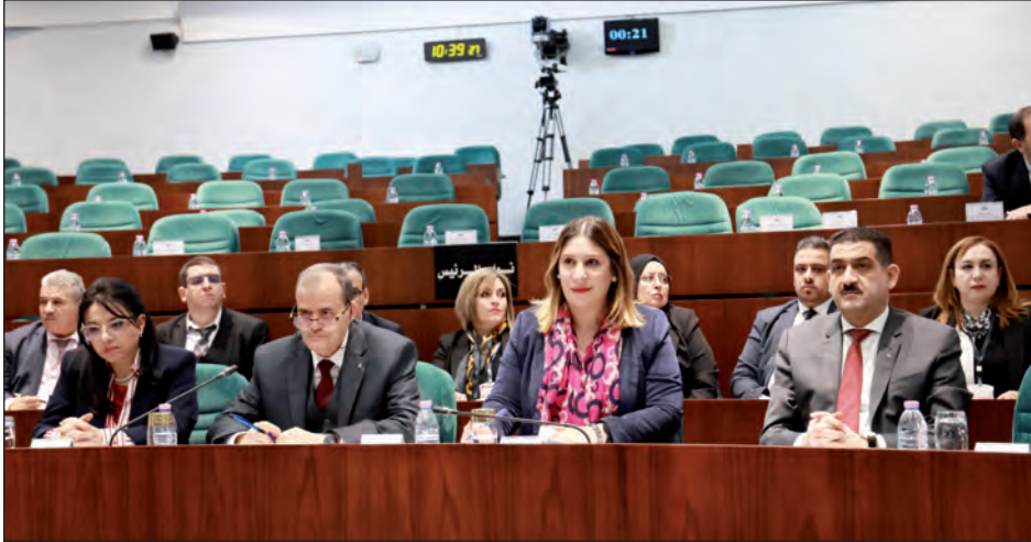
وزيرة التجارة الداخلية آمال عبد اللطيف: