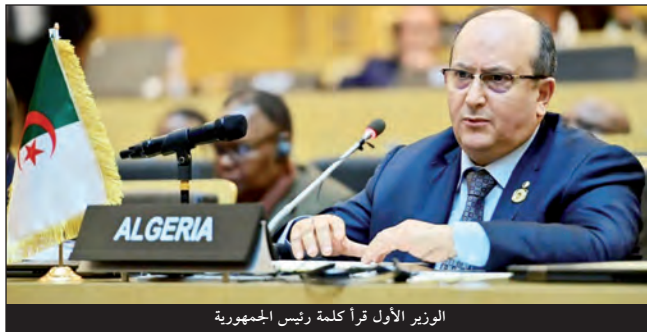
الوزير الأول قرأ كلمة رئيس الجمهورية

● الرئيس تبون يدعو لوقف جميع الأعمال العدائية بجنوب السودان ● نجاح جنوب السودان في تحقيق الاستقرار والازدهار هو نجاح لإفريقيا بأسرها