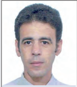
بقلم: ياسين مية مفتاح/وهران

فابسط يديك فقد بلغت نصابا ما بين معركة وأخرى لا نرى إلا الذي قد رهب الإرهابا "ملت" ثربك بالخيام تيمنا... تلك الخيام قبابا أطعمت خيل الغزو كل مهانة وأذقتهم يا ابن الكرام - عذابا أنا يا أمير رفعت حركك عاشقا... والحرف بعدك أرهق الكتأبا خيوط من النور الشفيف رأيت... ورأيت ثمة بارقا وسحابا ستظل تذكر "باب تومة" منقذا متصوفا إذ يفتح الأبوابا لا لم يطق ذاك الفؤاد بمن لجأ في حفظهم قد هيأ الأسبابا سران كتنا.. لم يكن في ليلنا إلا الوميض أضاءنا وأنسابا يا سيدي أنت الأمير مبعلا كل الملوك جعلتهم حجابا يا سيد الوطن الجميل تحية من شاعر لا يشتهي الألقابا