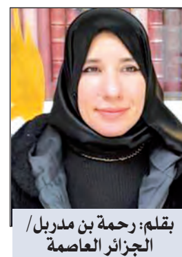
بقلم: رحمة بن مدريل / الجزائر العاصمة

ربما... ربما القلب مات والليل تؤذي الذكريات ربما صار الزمن أرجوحة الكلمات ربما وجهي تخلى عن انتظار النهار أو تأثيث الانهيار تراجع عن تقبيل الفراز مرارا قلت له ذلك القلب تريت لكن وجعي تحدث