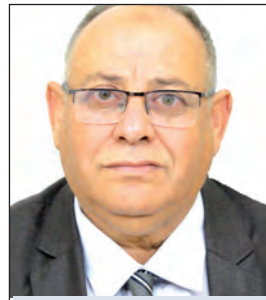
بقلم: د.عبد الحكيم صايم/جامعة وهران (2)

"حذثني، أيها الفجر"، وهو أمر يحمل التماسا وجوديا، أقرب إلى المناجاة الصوفية، كما أن الانزياح الأسلوبى يظهر في تشخيص الفجر واللباسه صفات إنسانية وروحانية. كما أن الألفاظ منتقاة بعناية،