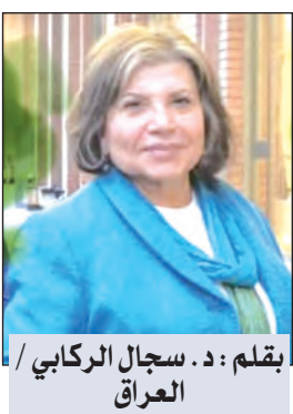
بقلم: د. سجال الركابي / العراق

ما هادنته...!! بل ... غرّة أجّحتّه لن يلومك دمع ما عدنا سوى أصدقاء! مؤلم حدّ الذبح هذا الهبوط... على حجارة مستنة بحروف باردة ظننتني ... ملككتك الساحرة وأرقك المُشتهى حتى ثمالة القصيدة !!! واجرحاه... ما عدت سوى ... إحدى إيقاعاتك الرتيبة سأمحو الحروف الثنائية أتم الصمود إلى الليل ليس للموجوع أياما آخر... لن أكتب بعد الآن سأنام ملء الجفون ... وأنت؟ لن يهزني أن تشرب قهوتك باردة...! بل ... سأهديك كأسا مترعة بشغف الجفاء!!!