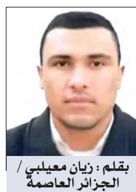
بقلم: زيان معيلي / الجزائر العاصمة

غفلة... غيبتك حبيسان صمت ينساب بين الظلال وشمس لم تولد بعد ظل يلتف على وجنتيك نغمة تذوّب الهواء وأصوات تتلوى في حافة الغياب كبتني يدك دموعي تتحرج على أوتار الليل همس متسبي يرقص على أهداب الفراغ نبضة... غفلة