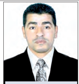
بقلم: د. وليد خالدي / بشار

وتأسيسا على ذلك، فقد كانت البواعث الأساسية لهذه الفقرة النوعية، وبشكل عام، الإغراق في ذكر التفاصيل الدقيقة المتعلقة بالصحراء، أي: بالتعرض لكل المظاهر التي لها علاقة بالتاريخ وبالعوالم والتقاليد والدين، والموروث الثقافي المتنوع والمناسبات الكبيرة المختلفة والحالات الإنسانية المتباينة، وبالتالي، تكون الذات إزاء رأسمال ثقافي يمنحها نظرة جديدة للحياة. تقول الساردة في هذا السياق "الواحة الصغيرة تنام على سفح جبال البرقة كصبيّة فاتنة غفت مأخوذة بسحر المكان الحال. صوت الأذان يرتفع من صومعة المسجد، يرفع صوت نداء الصلاة، أصوات تعزف سمفونية العويبة أو الفنادسة، ومن الجنان المتاخمة لزاوية الولي الصالح سيدي محمد بن بوزيان، تطل أشجار النخيل بشموخ، يهتّز سعفها الأخضر لمداعية نسائم منعشة خفيفة ". واستنادا إلى ذلك، تبقى صورة المكان عاقلة في الذاكرة من خلال تنشيط العملية السياحية محليا وعالميا، وكما هو معلوم، فإننا ندرك أهمية هذه الخاصية،