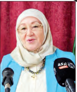
بقلم: سليمة مليزي

تنطلق هذه الدراسة من مقاربة نقدية هيرومينوطيقية، تسعى إلى تفكيك البنية الظاهرة للنص، والولوج إلى طبقاته الدلالية العميقة، من خلال قراءة مركبة تستند إلى تحليل الأسس اللغوية والبلاغية، والجمالية والفنية، والفكرية والفلسفية، فضلا عن الأبعاد النفسية، والسوسولوجية، والسيميائية التي ينهض عليها الخطاب الشعري. وتقوم هذه القراءة على افتراض أن النص الشعري ليس معطى مغلقا، بل كيانا