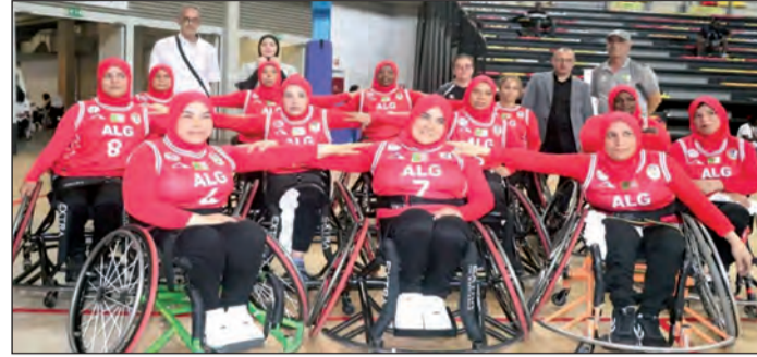
سيدات الجزائر تأهلن إلى بطولة العالم 2026 المقفلة بكندا، وهي ثالث مشاركة للمنتخب الوطني للسيدات في المونديال بعد نسختي 2018 و2022، ولدى فئة الرجال، أنهى المنتخب الجزائري

● سيدات الجزائر فزن على جنوب إفريقيا في نهائي مثير بلواندا