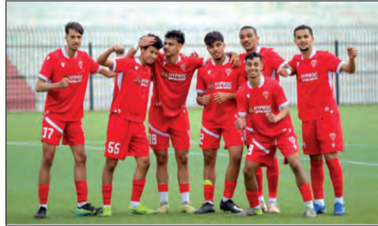
من المنافسة الوطنية. ويأمل الفريق في الحفاظ على نفس الديناميكية الإيجابية وتأكيد جدارته خلال الاستحقاقات القادمة.

قبل انتهاء البطولة بثلاثة جولات، في محطة جديدة ستشكل اختباراً حقيقياً لقدراته وطموحاته لمواصلة المشوار بنجاح نحو مستويات أعلى