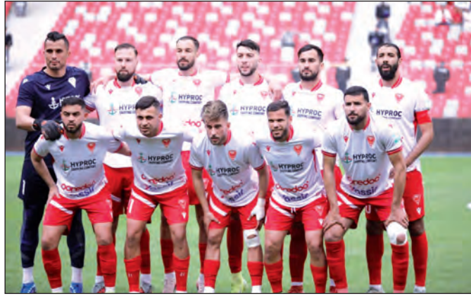
أبوالم المنتخب الوطني قبل المونديال.

● عودة إيديوين وطراوري تعزز صفوف النادي ● جنوى الإيطالية قد تستضيف التبرص الصيفي للمولودية