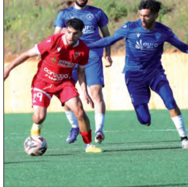
مخاوف في بيت و داد تلمسان قبل مواجهة اتحاد بشار الجديد