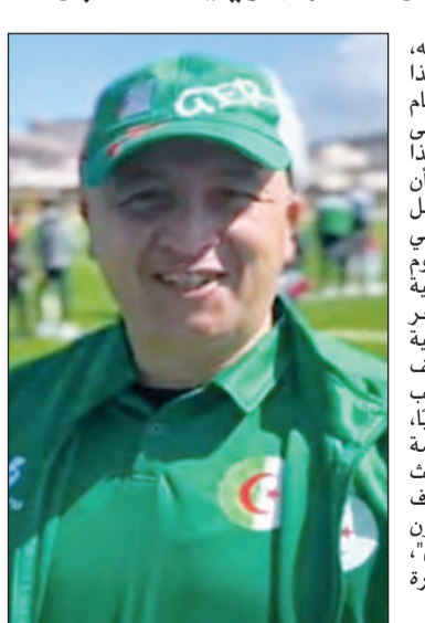
الأجواء، مبرزاً أن هذه البيئة الإحترافية من شأنها أن تساهم بشكل مباشر في تحسين مردود الرياضيين ورفع مستوى التنافس، مضميناً أن توفر مثل هذه الهياكل يضع الجزائر في مصاف الدول القادرة على احتضان التظاهرات الكبرى. وبخصوص التحضيرات الجارية للبطولة الإفريقية، كشف الناخب الوطني عن العمل المتواصل لضمان جاهزية كل الجوانب التنظيمية، موضحاً: "التحضيرات متواصلة لتنظيم البطولة الإفريقية شهر جويلية، وهناك عمل كبير يبذل من قبل القائمين على هذا الحدث لضمان نجاحه من جميع الجوانب التنظيمية والفنية"، مشيراً إلى أن التنسيق قائم بين مختلف المتدخلين لتوفير أفضل الظروف، سواء من حيث الاستقبال أو التأطير أو الجوانب التقنية المرتبطة