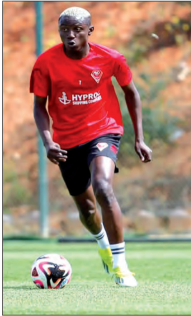
بلخيتر يستعيد مستواه ويمنح الإضافة للمولودية