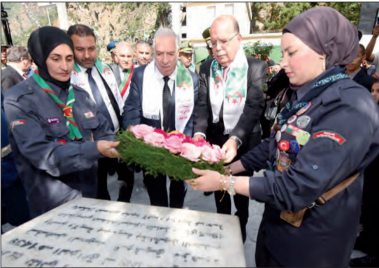
بمناسبة إحياء اليوم الوطني للذاكرة المستعمر الفرنسي في حق المتظاهرين المخلد لمجازر 8 ماي 1945 التي اقترفتها بكل من سطيف وقالمة وخرطلة.

الوزيرة الفرنسية المكلفة بقدامى المحاربين من سطيف: