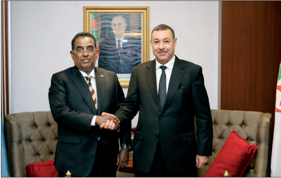
نشأت مكثف لوفد مجموعة الصداقة "الجزائر- تركيا" بأقتر: بحث القضايا المستجدة على الساحة الدولية