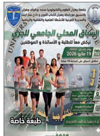
مميزة داخل جامعة العلوم والتكنولوجيا محمد بوضياف وهران محمد بوضياف بوهران.

تستعد جامعة وهران للعلوم والتكنولوجيا محمد بوضياف لتنظيم منافسات رياضية بمناسبة يوم الطالب ، إحياء لعيد الطالب المصادف لـ 19 ماي من خلال تنظيم الطبعة الأولى للسباق المحلي الجامعي للجري تحت شعار "نركض معا" بمشاركة واسعة من مختلف أفراد الأسرة الجامعية ، بسباق هذا الموعود الرياضي يوم الثلاثاء 19 ماي 2026 بداية من الساعة العاشرة صباحا داخل الحرم الجامعي للجامعة بمبادرة من النادي الرياضي الهواوي "منار إيسطو" وبالتنسيق مع المديرية الفرعية للأنشطة العلمية والثقافية والرياضية إلى جانب رابطة وهران لألعاب القوى، وتهدف هذه المبادرة إلى ترسيخ ثقافة النشاط البدني داخل الوسط الجامعي وخلق أجواء تفاعلية تجمع الطلبة والأساتذة والموظفين في إطار رياضي، يكرس روح الجماعة والتنافس الشريفين زمانا مع الاحتفال بعيد الطالب، وأكد لمعالي أمين المدير الفرعي للأنشطة العلمية والثقافية والرياضية أن عدد المشاركين المنتظر قد يفوق 200 مشارك مشيرا إلى أن التوقعات الحالية ترجح حضور ما بين 250 و 300 مشارك في ظل الإقبال الكبير الذي تشهده عملية التسجيل من الأسرة الجامعية، وستكون المشاركة مفتوحة أمام الطلبة والأساتذة والعمال، حيث خصصت إدارة التنظيم عملية التسجيل عبر مكتب المديرية الفرعية للأنشطة أو عبر مكتب النادي الرياضي منار إيسطو مع دعوة الجميع للمساهمة في إنجاح هذه الطبعة الخاصة، التي ينتظر أن تصنع أجواء رياضية