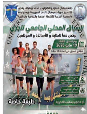
مميزة داخل جامعة العلوم والتكنولوجيا محمد بوضياف وهران محمد بوضياف بوهران.

الأرض بنتيجة هدفين دون مقابل، في مباراة لم تقدم خلالها تشكيلة الحناية أشياء تمكنها من العودة بنتيجة إيجابية، وبهذه الخسارة تراجع الشباب إلى الصف الـ 14 بعدما تجدد رصيده عند النقطة الـ 31، ليتأكد سقوطه بشكل رسمي إلى بطولة الجهوي الثاني إلى جانب نصر