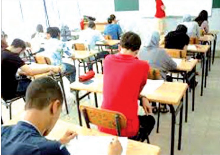
واللوجستية والأمنية الكفيلة بإنجاح امتحانات وتمكينهم من اجتياز اختباراتهم في أجواء البكالوريا وضمان راحة المترشحين هادئة ومناسبة.

● تخصيص 104 مراكز إجراء موزعة عبر مختلف البلديات