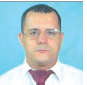
بقلم: أوليد بوعديلة

موقفه الثقافي والسياسي عبر السرد الواقعي، ويوظف الشعر العربي في محطاته المختلفة، ليصل إلى جوهر الفكرة وعمقها، وينتقد النخبة الجزائرية والعربية التي ابتعدت عن يوميات الناس، ويدعو في مقالاته إلى قراءة عقلانية وعلمية للتاريخ والنص الديني، كما يتأمل بوعي عميق مختلف الخطابات الإيديولوجية في المجتمع ويكشف صراعاتها. يقول: "يبي أن تشير إلى أن الاختلاف ليس خطراً على أحد، لكن الخطر العظيم يكمن في التعصب وثقافة التخوين والإقصاء والمبالغة في التشهير، ورفض الحوار، والدعوة إلى الفتنة والفرقة المؤدية إلى الاستقطاب المرضي". لا يتردد الكاتب علي خفيف، في البحث في ظاهرة السطحية في المجتمع العربي، مع غياب التفكير لدى الأفراد، ويكتب سلسلة مقالات عن المشهد الانتخابي والسياسي الجزائري (وفيهِ ملامح شبه من المشهد في بعض الدول العربية)، وهنا سيتأكد القارئ من حضور ثقافة سياسية كبيرة ومعرفة بالاتجاهات والتاريخ السياسي عند صاحب الكتاب، وهو الذي يريد من كل الأسر السياسية والفكرية ببلده الجزائر أن تتعاون لخدمة الأمة. يقول في مقاله "أمنيات على هامش الخريطة الانتخابية"، داعياً إلى تفاعل حوار أبناء الوطن بمختلف مكوناتهم الفكرية: "تجتمع لدينا قيم الكرامة والحرية والتضحية المستمدة من ثورتنا العظيمة، وقيم الأخلاق والعمل والإينار والنزاهة المستمدة من ديننا الحنيف، وقيم حقوق الإنسان والديمقراطية والانفتاح والتعدد اللغوي والفكري المستمدة من الحداثة". ويقراً الدكتور الناقد الثقافي علي خفيف، رهن الأمة بالعودة إلى محطات التاريخ المختلفة، ويتأمل الراهن محاوراً له ومحللاً، منطلقاً من حدث تاريخي ما، مثل مقاله