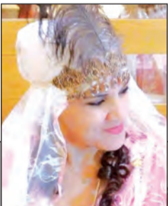
بقلم: غول عبد القادر مي / الأغواط