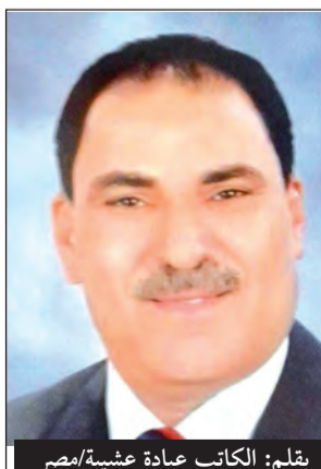
بقلم: الكاتب عبادة عشيبة/مصر

يحدث أن يعاودني الوعي إثر نبض لبصيص استمقاة، فيلامسني في الحال طمخ متوال وواقع يتصاعد إلي من عمقه المخيب، أتحمسه، فأتيقنه لا محالة مفعما، فارتعد. وفي التو واللحظة تقسو إطلالة خفاياه الطافحة على النفس أشد ما تكون القسوة، بجبروت يعنف، يوقفني موجعا، أتولى الألم، ومعه الوك التحسس، فأنزف من فوري إدراك تواجدي من جديد. بعض وعي كلما يعاودني أتلمسه ساخطا، يتصفح مرتابا لوحات متعددة، تتصل صفحتها الأولى بصفتها الأخيرة، رسوماتها يتفحص من عمق دواخلها ماضي، جميعها تشكل صحيفة أحوال تترق دامية، ينظرها إدراكي العابر شاخصا، فأطبق الجفنين، ومن ثم يعاود جلّه الارتداد.