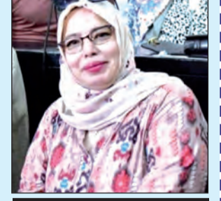
بقلم: صليحة نعيجة/قسنطينة

لكان أراضى وبحاراً وانهاراً وسهولاً لكان عرشاً حل بهو القلب فاستراح ونام 3 هناك حيث المنافي حيث الجينات حيث اللغات وموائى الكلام تفتح مصراعها للجانيين هناك حيث الهبوب والذهول أجتمع بدروب الرحلة أقع فريسة السهو لخطل الكلام فأعرق حيث ينعطف اللاوعي ويتعرف على لسان هدهد التواريخ يسلم وثيقة انهزامه في شكل فضفضة لا تلتيق بسير المرحلة