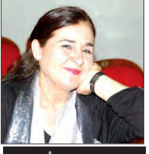
بقلم: زينب الأعوج

كثيرا ما ينسى السائل أو يتناسى أو يجهل أن العملية الإبداعية ليست خطايا سياسيا أو دينيا مباشرا صريحا وواضحا، يشحن الناس في اللحظة إيجابيا أو سلبا. العملية الإبداعية هي تراكم ممتع، مضمّن، وطويل، يشعل فتيلته ويفرج عن نوره في اللحظة المناسبة التي تحتاجه، ولما يلتقطه العقل النير الذي يهدف إلى حركة ما، من أجل هز المجتمع وتغيير الذهنيات ضد الظلام والجهل والتخلف والظلم، ومن أجل الحق بشكل عام. طبعاً هذا لا يعني أنه ليست هناك استثناءات واكتبت