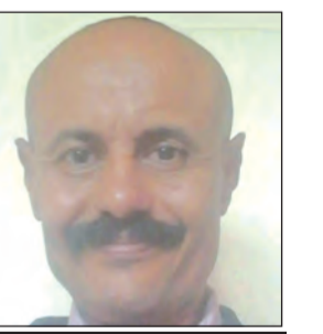
بقلم: عبد الباسط الصدي أبو أميمة/اليمن

تاقت خيوط الضوء من نظرة وعبرت صدري عبر الرمش المتمدد من مدخل قصر الحمراء إلى مدخل شرياني من أجل عينها ملأت الأرض ابتساماً من حروف اسمي لما دمع الوريد أذاب الصخر ولأجلها نثرت فوق الجبال وديان ورد لما دموع الورد تركت على النجوم علامات وكتبت لعيونها بالحجر كلمات تراها الأعين من المكسيك يا من عشقت دريك ونثرت أوراق الرمان دليني على حنايا قلبك دليني متى ما أقمر في فنزويلا ليل فأنا يا امرأة لعيونك عاشق من قبل حتى أن تولدي أنت أريد أن تكون معا بأي مكان تحت ظل الشمس وأريد أن أضمك إلى قلبي وأسكن إلى الدار