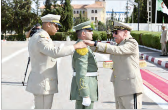
مختلفة من الدفعات المتخرجة، والذي تميز بالدقة والانضام التامين، ليتفقد الوفد العسكري بعدها ورشات التكوين بالمدرسة، ومتابعة "روبوتاج" شامل لنشاطات المدرسة خلال السنة

وشملت الدفعات المتخرجة التي حملت اسم المجاهدة الراحلة "بن سعيد خيرة"، كل من "الدفعة الخامسة عشر لضباط دورة الإقتان"، "الدفعة الرابعة عشر لضباط دورة التطبيق"، "الدفعة السادسة من التكوين القاعدي المشترك للطلبة الضباط العاملين"، إلى جانب "الدفعة الثالثة والثلاثين لضباط الصف العاملين المترشحين لنيل الأهلية العسكرية المهنية درجة ثانية اختصاص مرض"، و"الدفعة الرابعة عشر لضباط الصف العاملين المترشحين لنيل الأهلية العسكرية المهنية درجة ثانية اختصاص إدارة الصحة"، وكذا "الدفعة الخامسة والثلاثون لضباط الصف العاملين المترشحين لنيل الأهلية العسكرية المهنية درجة أولى اختصاص مرض"، و"الدفعة الثالثة والعشرون لضباط الصف العاملين المترشحين لنيل الأهلية العسكرية المهنية درجة أولى اختصاص إدارة الصحة" و"الدفعة الثالثة لطلبة الشهادة العسكرية المهنية درجة ثانية اختصاص