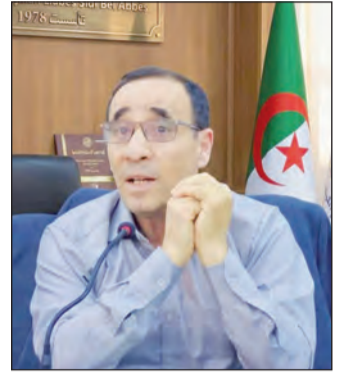
بقلم: ميلود بلعاليه دومه / جامعة حسيبة بن بوعلي بالشلف

ثانيا: الحوار بوصفه "محادثة": نقصد بها المحادثة الأصلية، أعني الكيفية التي يجزئنا بها الحديث إليه، كما لو أننا متورطون منذ البداية في المحادثة قبل كل اختيار من قبل الذات، وهذا ما تفيده العبارة اليومية حين نقول "لقد أخذنا الحديث أو الكلام" أثناء حوار شيق بين اثنين. مما يدل على أن المحادثة بمعناها التأويلي ليست محاولة لإظهار أفضلية رأي على حساب رأي آخر وحسب، وإنما هي فرصة لتترك موضوع الحوار يقول ذاته، الأمر الذي يفضي إلى فهم مشترك للموضوع، وتاليا إلى "تأويل مشترك للعالم". ثالثا: الحوار بوصفه "ترجمة": الترجمة في معناها التأويلي تجربة حقيقية للوعي، أعني إمكانية الحوار بمعناه الإنساني الأصلي، فهي تعكس تجربة "الانت" الحقيقية كما يقول "غدامير"، إذ في فعل الترجمة نفسها يحدث الفهم، شريطة ألا نذهب الترجمة هنا فقط لترجمة لغة إلى لغة أخرى، وإنما كعمل محايث للغة ذاتها، بما في ذلك اللغة الأم. فالترجمة هي، بهذا المعنى، محاولة للانتصار على عنصر الغرابة من جهة، ومحاولة لاستكشاف بُعد الغيرية بوصفه بعدا أساسيا في فهمنا لذواتنا وللعالم معا. فالترجمة بمعناها الهرمينوطيقي الخاص هي تعبير عن "الحوار الذي هو نحن" كما يقول هيدغر، وليست مجرد ملكة للتحكّم في اللغات وحسب. فالغاية، كما ترى، أبعد وأشم.