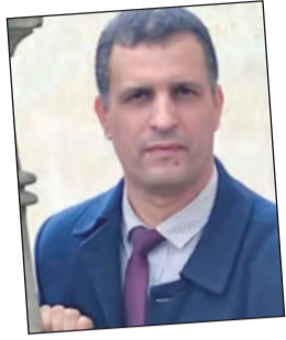
بقلم: محمد عدلان بن جيلالي / جامعة وهران

وثقب هامشي كالحقيقة في المجاز وفي البيان... لا شيء سيأتي معي إلا الصهيل... وأثم قد جردوني من حصاني... كيف الوصول حبيبي وأنا المسافر والوصول؟ كالفلسفة فوق أوصاف الأمانتي... أمشي على درج طويل كالأعاني... تتسلق الوجدان أمنية كما يتسلق الحبق الجدار... أريد سيدي الوصول إلى يدك ولوعلى مضض الدقائق والثواني... لكثني أمشي لكي أمشي... وأذبل كالفلسفة فوق أوصاف الأمانتي... أمشي على درج يشيعه الخريف كميت فوق الثرى... يفضني إلى درج فينقلني المكان من المكان إلى المكان... لا شيء في قلبي سوى قلبي... وذكرى طمعة امرأة أحببتي... ولم أكن جازها أبدا لعاصفة الكمان... ولا أريد سوى الوصول إليك ذابحتي بسيف البرق... ليس يراه إلا العاشقان كيف الوصول حبيبي وأنا المسافر والحقبة والمحطة في معادلة البداية والنهاية والزمان؟ لا شيء في جيبتي سوى جيبتي... قاتل... إما قاتل.