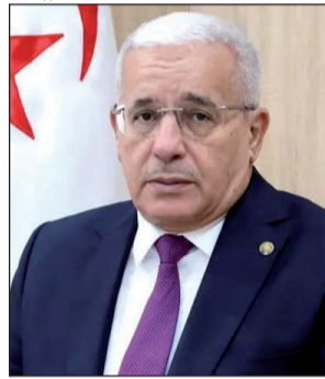
كل عام وأنتم بخير.

هنأت رئيسة المحكمة الدستورية، السيدة ليلي عسلاوي، أمس، الشعب الجزائري بمناسبة حلول السنة الهجرية الجديدة، متمنية أن يعيده الله تعالى بدوام نعمة الأمن والاستقرار على الجزائر. وكتبت رئيسة المحكمة الدستورية في نص التهنية: "بحلول أول أيام شهر محرم وغرة العام الهجري الجديد 1448، يسعدني أن أقدم باسمي وباسم كل أعضاء وإطارات وموظفي المحكمة الدستورية، إلى كافة الشعب الجزائري، وإلى الأمة الإسلامية جمعاء، بأخلص التهاني المقرونة بأصدق الأمان، راجية من المولى عز وجل أن يعيده علينا جميعا بالخير واليمن والبركات، وأن يمن على وطننا