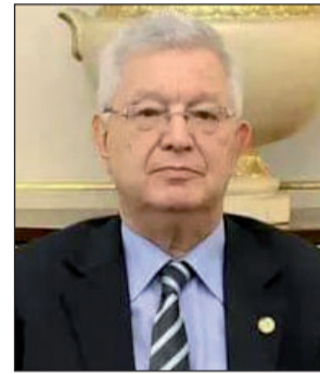
كل عام وأنتم بخير.

هنأ رئيس المجلس الشعبي الوطني، السيد إبراهيم بوغالي، الشعب الجزائري والأمة الإسلامية جمعاء، بمناسبة حلول السنة الهجرية الجديدة 1448. وكتب السيد بوغالي على حسابه الخاص عبر مواقع التواصل الاجتماعي: "ستقبل عاما هجريا جديدا ونحن نتطلع بثقة أن تحمل غرته مزيدا من بشائر الخير والنماء للشعب الجزائري والأمة الإسلامية جمعاء، نستقبله ونحن أشد ما نكون عزيمة وإصرارا على مواصلة مسيرة بناء الجزائر المنتصرة.