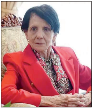
العالي بدوام الأمن والاستقرار.

رئيسة المحكمة الدستورية ليلي عسلاوي: أصدق الأمان بدوام الاستقرار